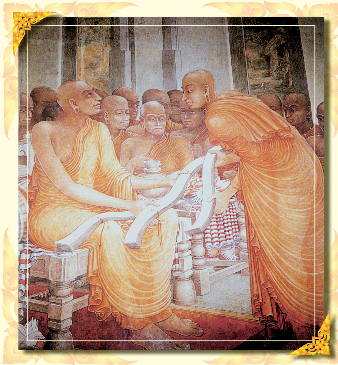
ท่านพระพุทโธสะ นำคัมภีร์วิสุทธิมรรค ที่ท่านรจนมาแล้ว ๓ ชุด ถวายพระสังฆเถระ ท่ามกลางชุมนุมสงฆ์คณะมหาวิหาร ภาพจิตรกรรม ณ ถ้ำยาศน์วิหาร ศรีลังกา